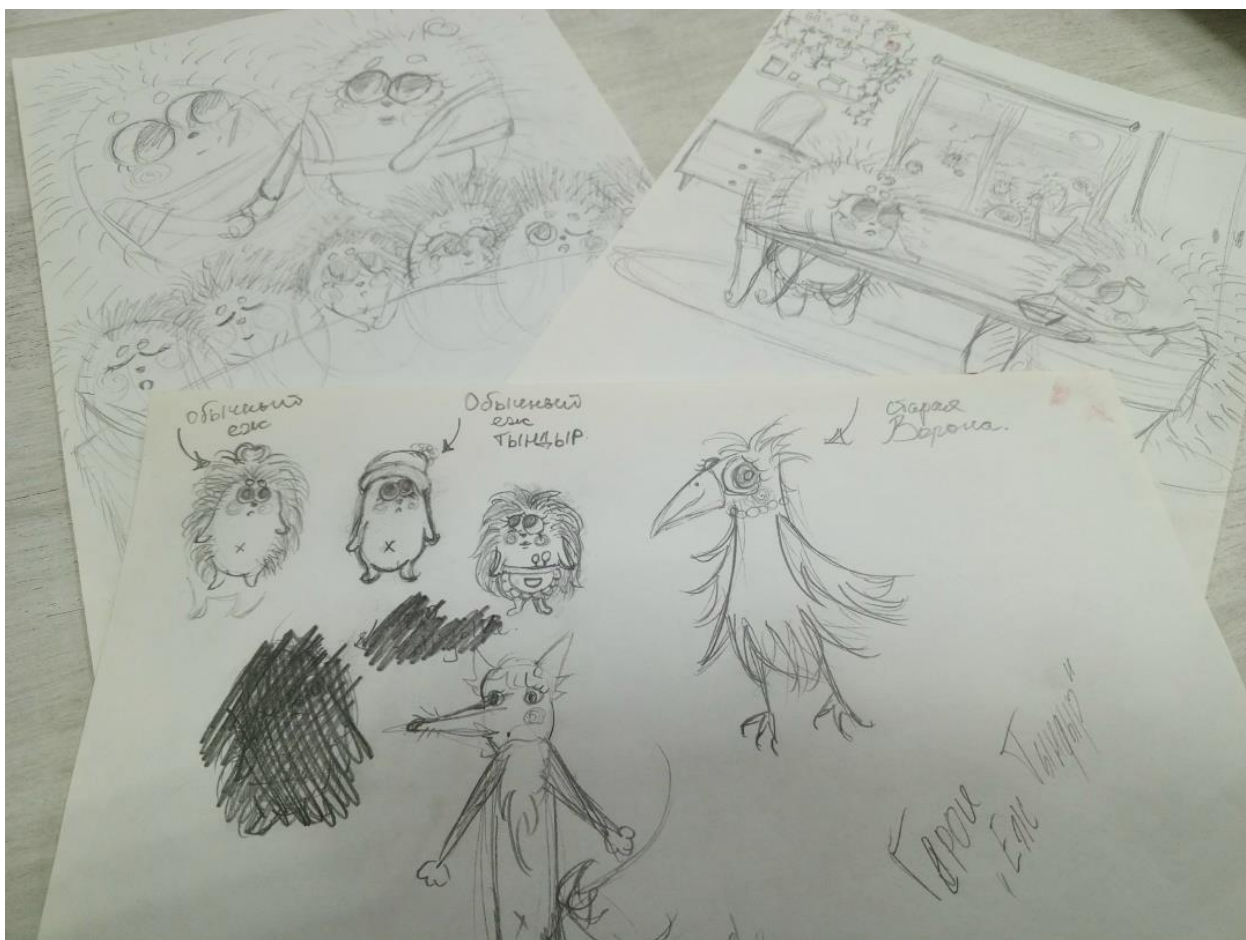
Это рисунок девочки Лизы из проекта «Проба пера»

Проекты охватили десятки населённых пунктов Архангельской области: Архангельск, Северодвинск, Новодвинск, Коряжма, Плесецк, Коноша, Вельск, Карпогоры, Сольвычегодск, Шенкурск, Пинежский район, Холмогорский район, Устьянский округ, Няндомский округ, Виноградовский район, а также деревни Пасьва, Никифоровская, Андреевская, Лохново, Часовенская, Спасская, Молодиловская и многие другие.